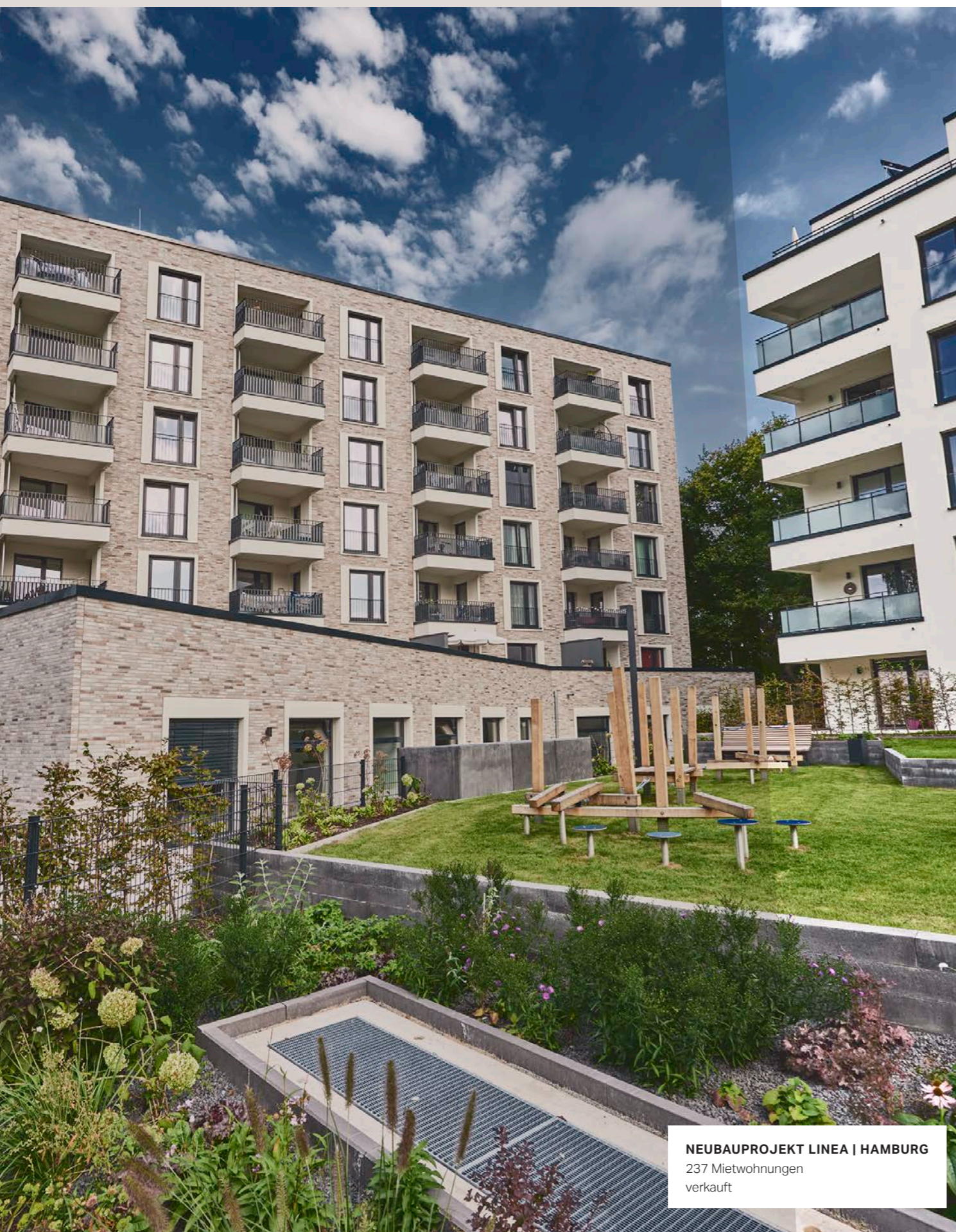
NEUBAUPROJEKT LINEA | HAMBURG 237 Mietwohnungen verkauft

Die Erstkonsolidierung der meravis Urban Q erfolgte zum Erwerbszeitpunkt, dem 8. Dezember 2021. Die Kapitalkonsolidierung der neu erworbenen Anteile an der meravis Urban Q führte zu einem als Geschäfts- oder Firmenwert aktivierten Unterschiedsbetrag in Höhe von T€ 3. Im Berichtsjahr wurde der aktivierte Geschäfts- und Firmenwert in Höhe von T€ 3 vollständig abgeschrieben.