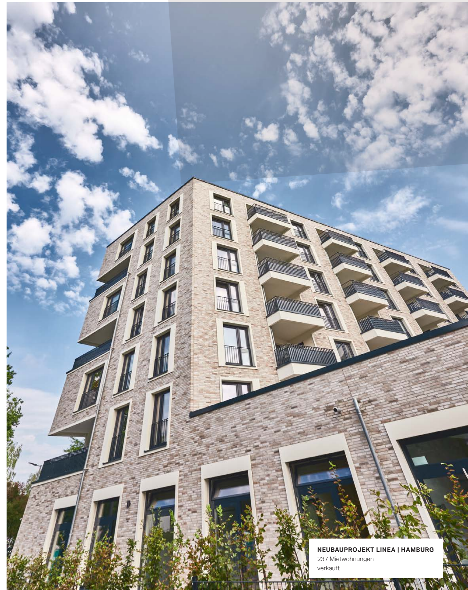
NEUBAUPROJEKT LINEA | HAMBURG 237 Mietwohnungen verkauft

Am 31.12.2021 bestanden Mietkautionen gemäß § 550 b BGB im meravis Konzern i.H.v. T€ 12.721 und bei der meravis GmbH i.H.v. T€ 6.178, die auf einem offenen Treuhandkonto geführt werden. Sie werden nicht in der Bilanz ausgewiesen.