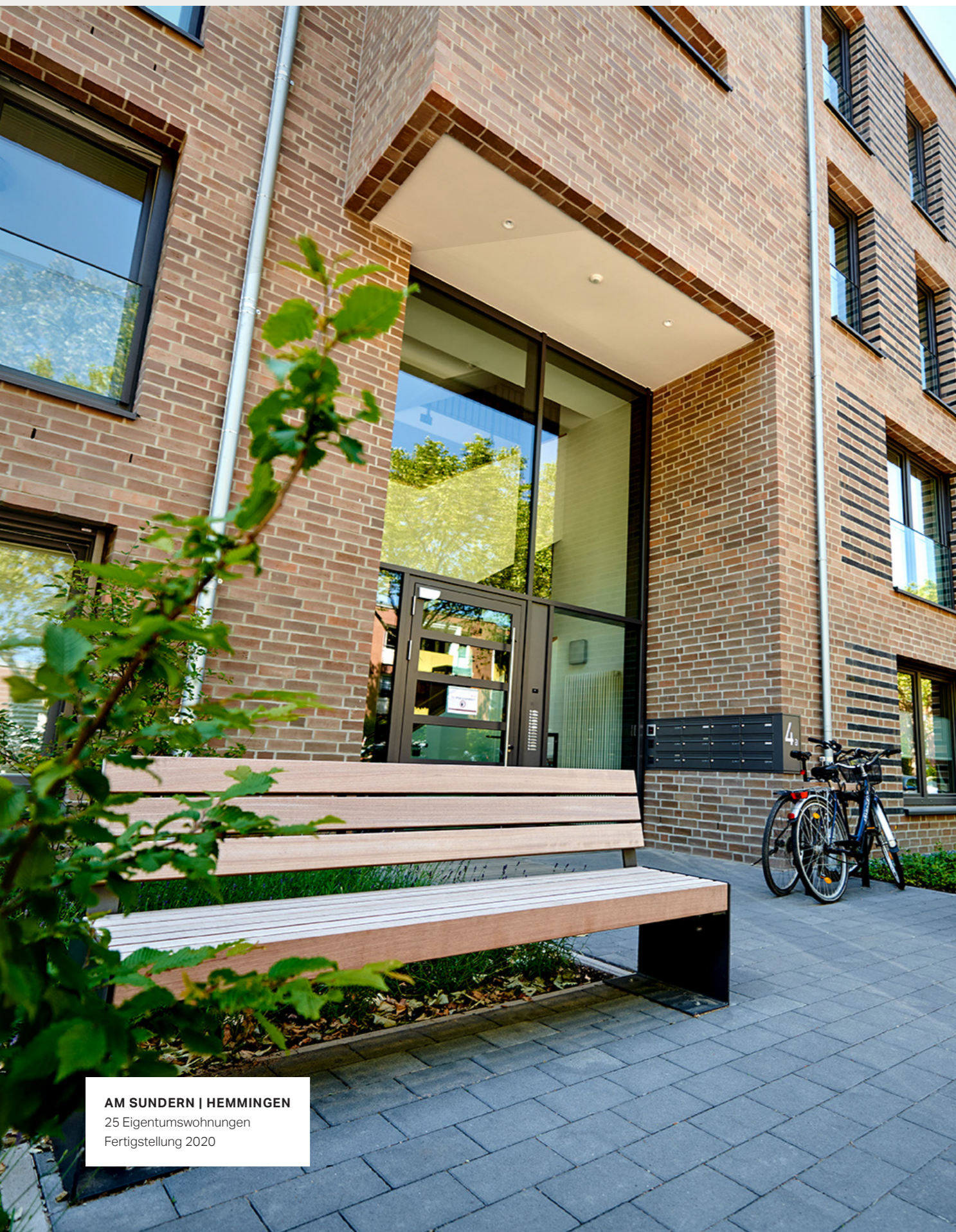
AM SUNDERN | HEMMINGEN 25 Eigentumswohnungen Fertigstellung 2020