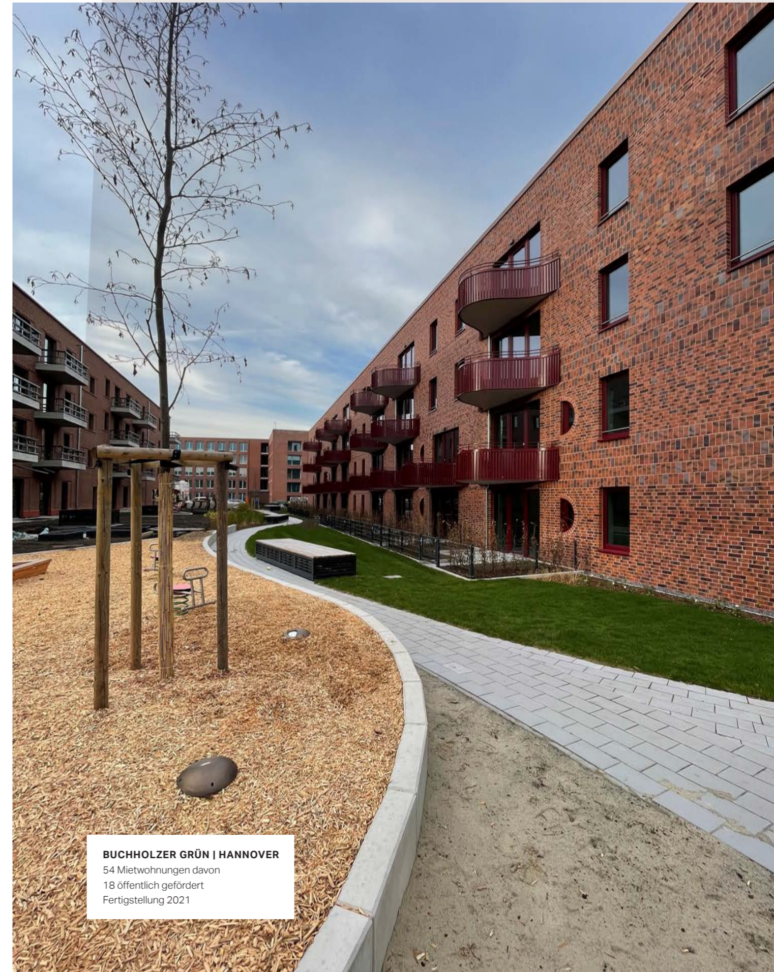
BUCHHOLZER GRÜN | HANNOVER 54 Mietwohnungen davon 18 öffentlich gefördert Fertigstellung 2021