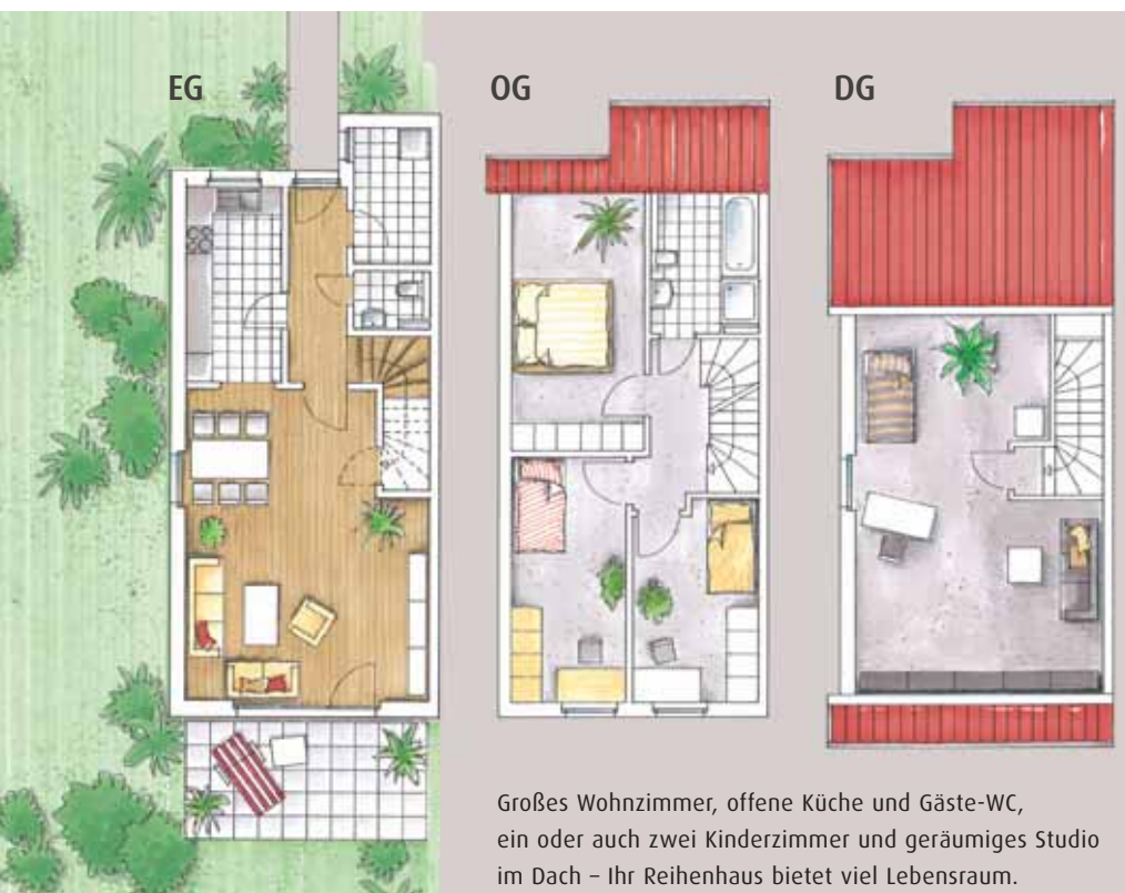
Großes Wohnzimmer, offene Küche und Gäste-WC, ein oder auch zwei Kinderzimmer und geräumiges Studio im Dach – Ihr Reihenhäuser bietet viel Lebensraum.

Unser Vertriebsteam berät Sie gern: Telefon 0511/49602-26