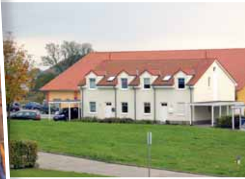
Hinter dem kleinen Fenster ganz links...