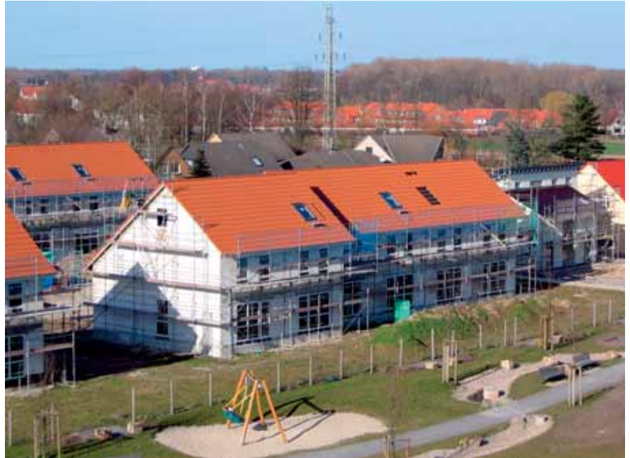
Zum Richtfest im Februar ist bereits der Park südlich der Reihenhäuser zu erkennen.

In Arnums Astrid-Lindgren-Straße werden im Herbst 25 Reihenhäuser bezugsfertig. Auf 122 Quadratmeter Wohnfläche findet sich alles, was die Familie braucht: großes Wohnzimmer mit offener Küche,