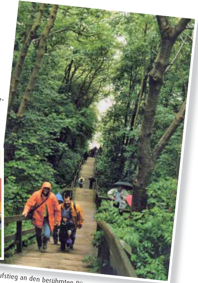
Aufstieg an den berühmten Rügener Kreideklippen.