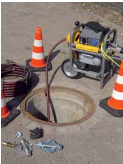
Mit Bohrköpfen wird das Rohr aufgefräst, Schleuderkettenaufsätze entfernen den Rest.

Was sie meistens als Verursacher finden: Damenhygienemittel, Haare, Windeln, Papier oder Bau rückstände. Auch ein sehr sicheres Mittel zur Verstopfung: Katzenstreu. Denn dort, wo das Abwasserrohr aus der senkrechten Fallstrecke in die Waagerechte übergeht, sam-